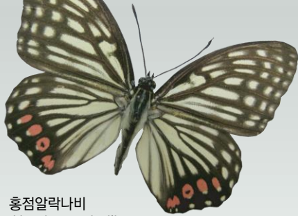
홍점알락나비 Hestina assimilis