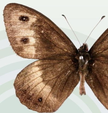
산골뚝나비 Hipparchia autonoe